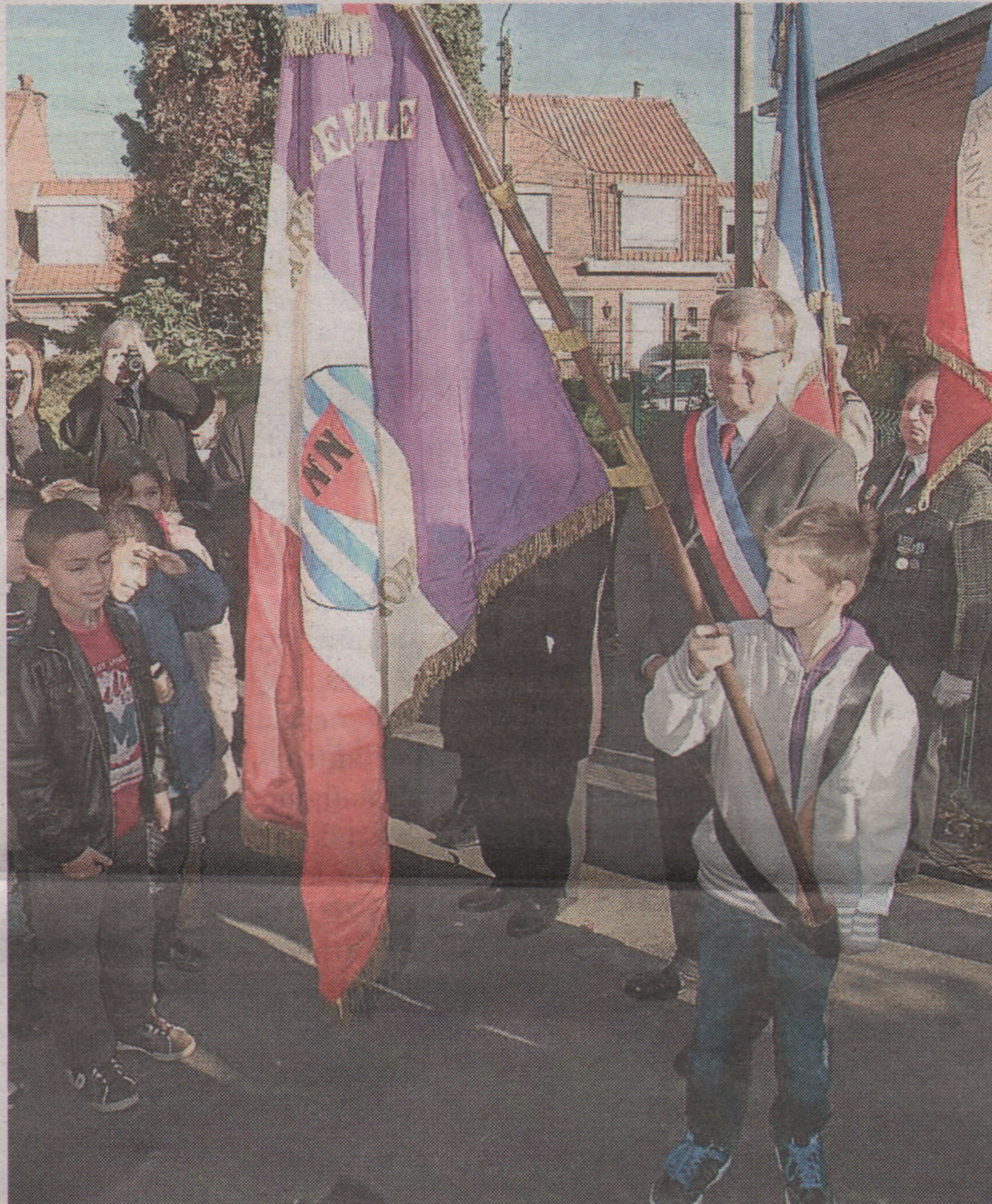
Un premier élève de l'école Jean-Zay a reçu, à l'issue de la cérémonie, un drapeau de l'Union des anciens résistants.

Hier matin, c'était comme une répétition. Ban, sonnerie aux