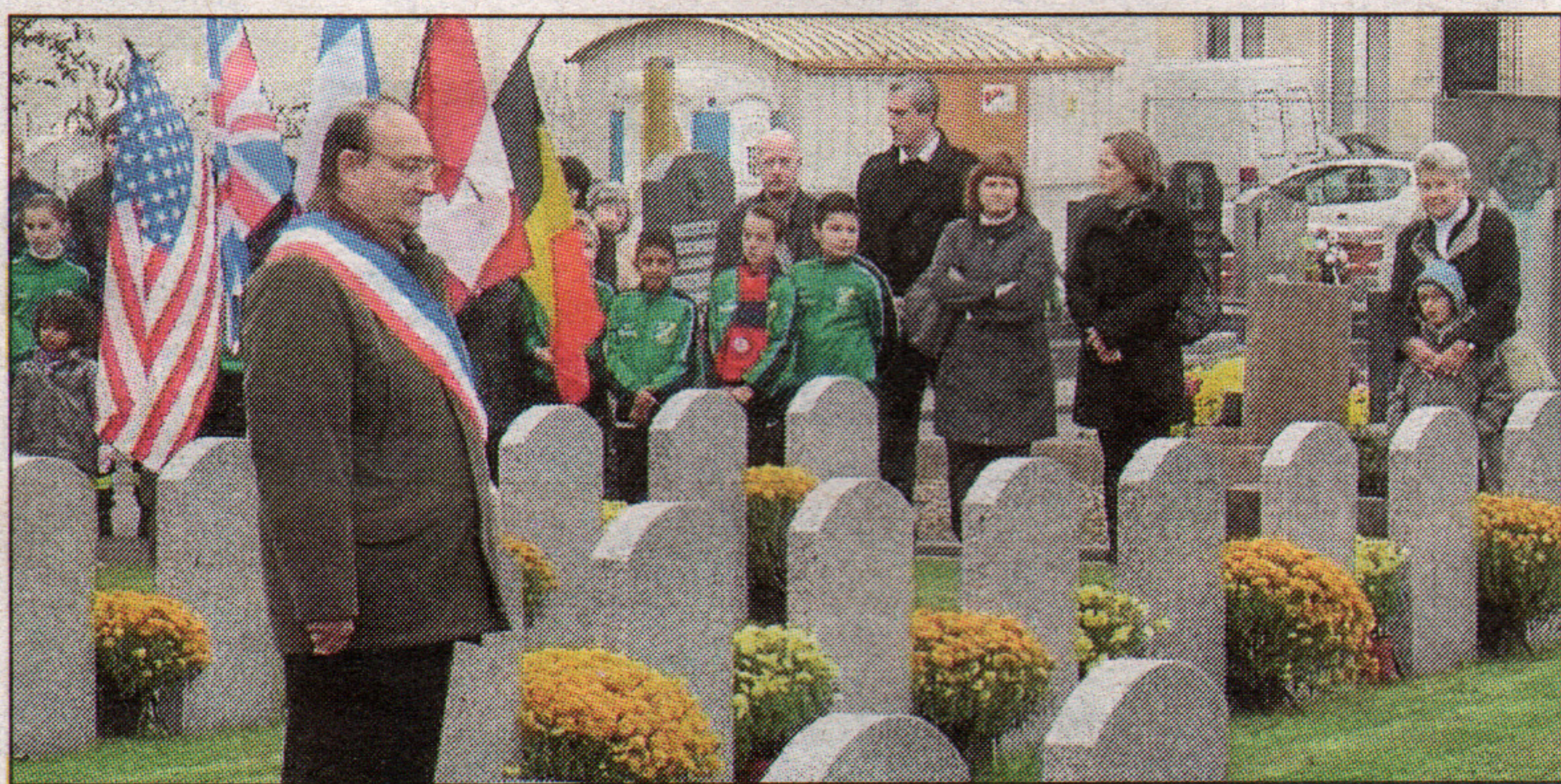
Élus et représentants d'associations étaient accompagnés d'élèves de l'école Malraux.

Il y avait du monde vendredi aux commémorations du 11 novembre. Le cortège qui s'est rendu au monument aux morts était composé de la musique municipale, suivie de jeunes footballeurs de l'Iris Club, des élèves de l'école Malraux, des représentants des associations patriotiques et d'anonymes, souhaitant s'associer à cet événement. L'adjoint aux anciens combat-