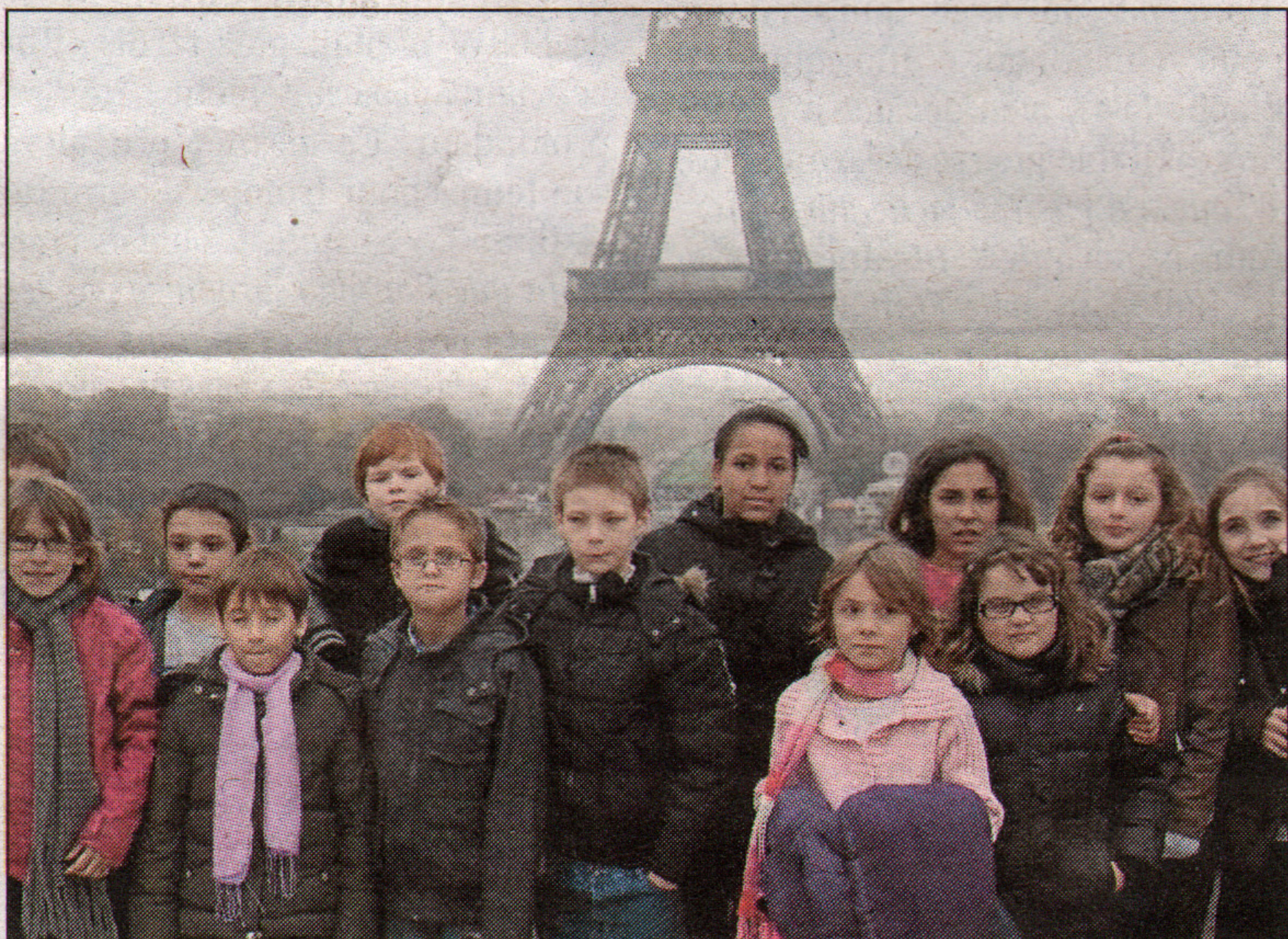
Une aventure parisienne qui s'est achevée par un tour panoramique des grands monuments.