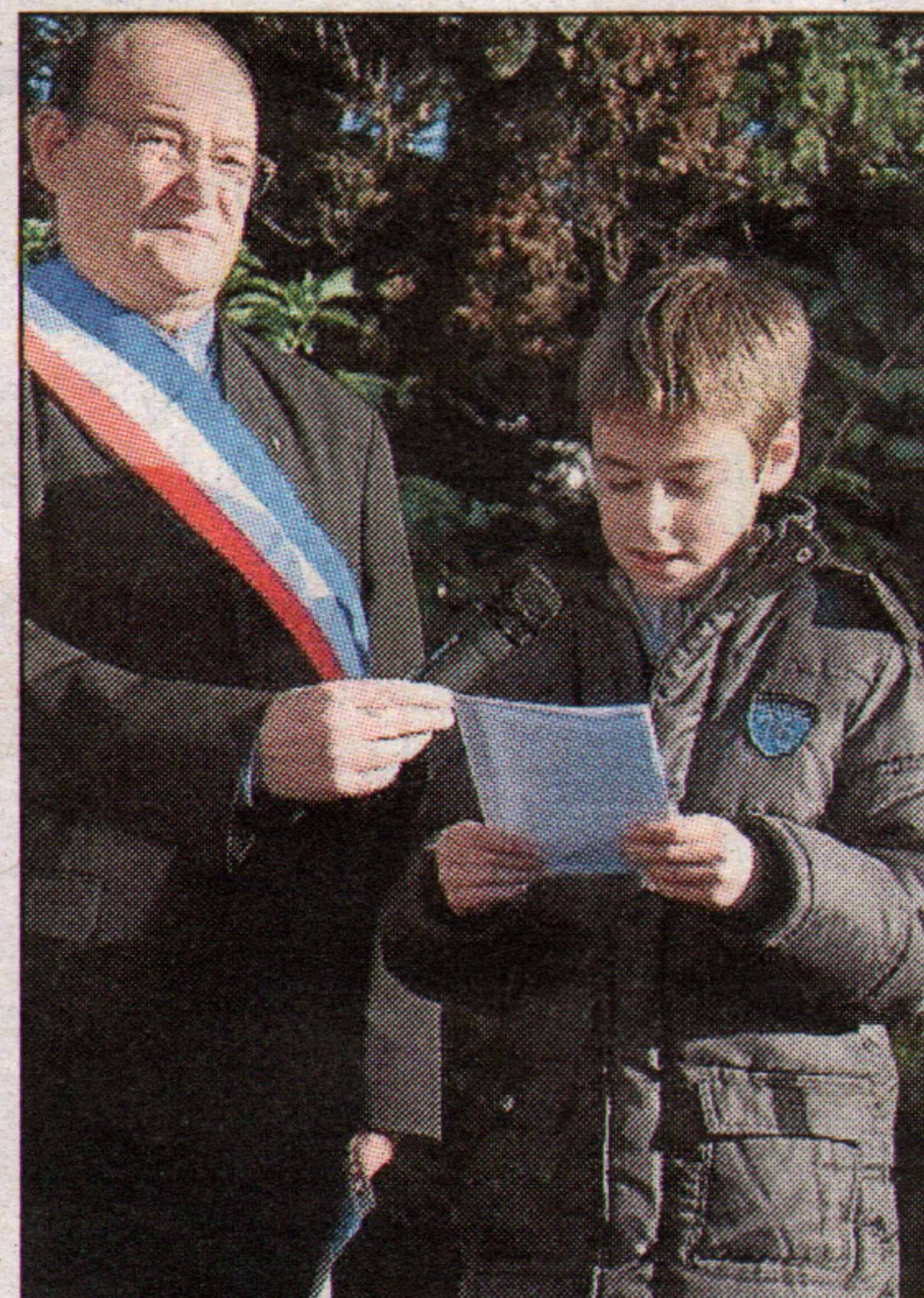
Des « Lettres de poilus » ont été lus par les élèves.