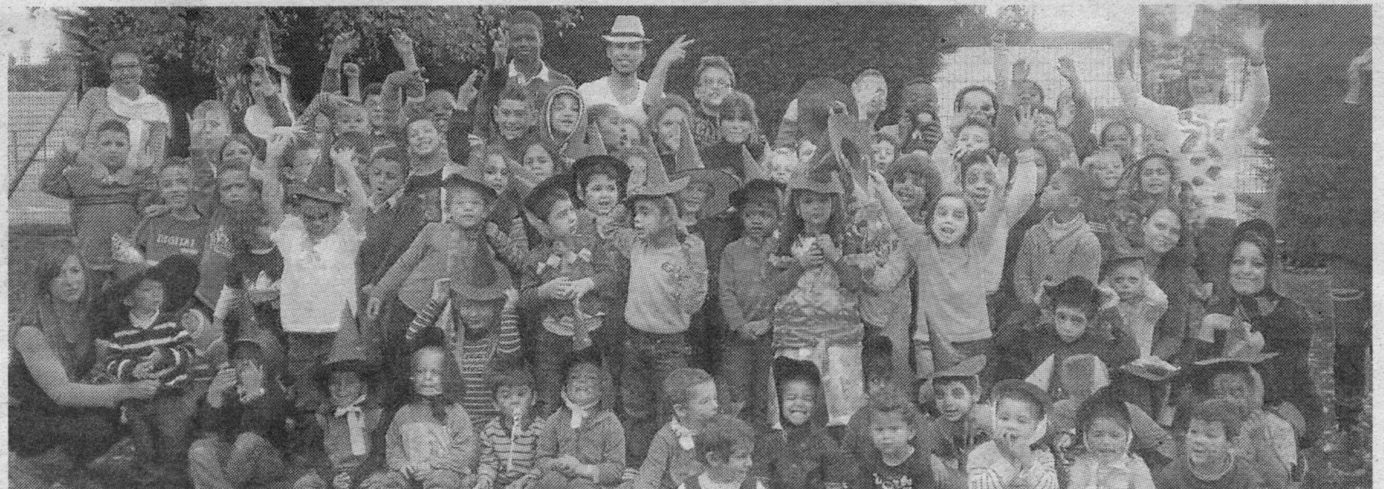
Plus de 80 enfants maquillés et déguisés ont fait la fête et ont profité d'un bon goûter.

Ce mercredi sonnait la fin des vacances de la Toussaint au centre social des Hauts-Champs. De nombreuses activités avaient été proposées aux enfants de 2 ans et demi à 13 ans, avec notamment un spectacle de cirque à Lille, de la piscine, un tournoi de football, un atelier culinaire et créatif et, pour finir les vacances en beauté, un bal des sorciers. ● FRANCIS MUylaert (correspondant local)