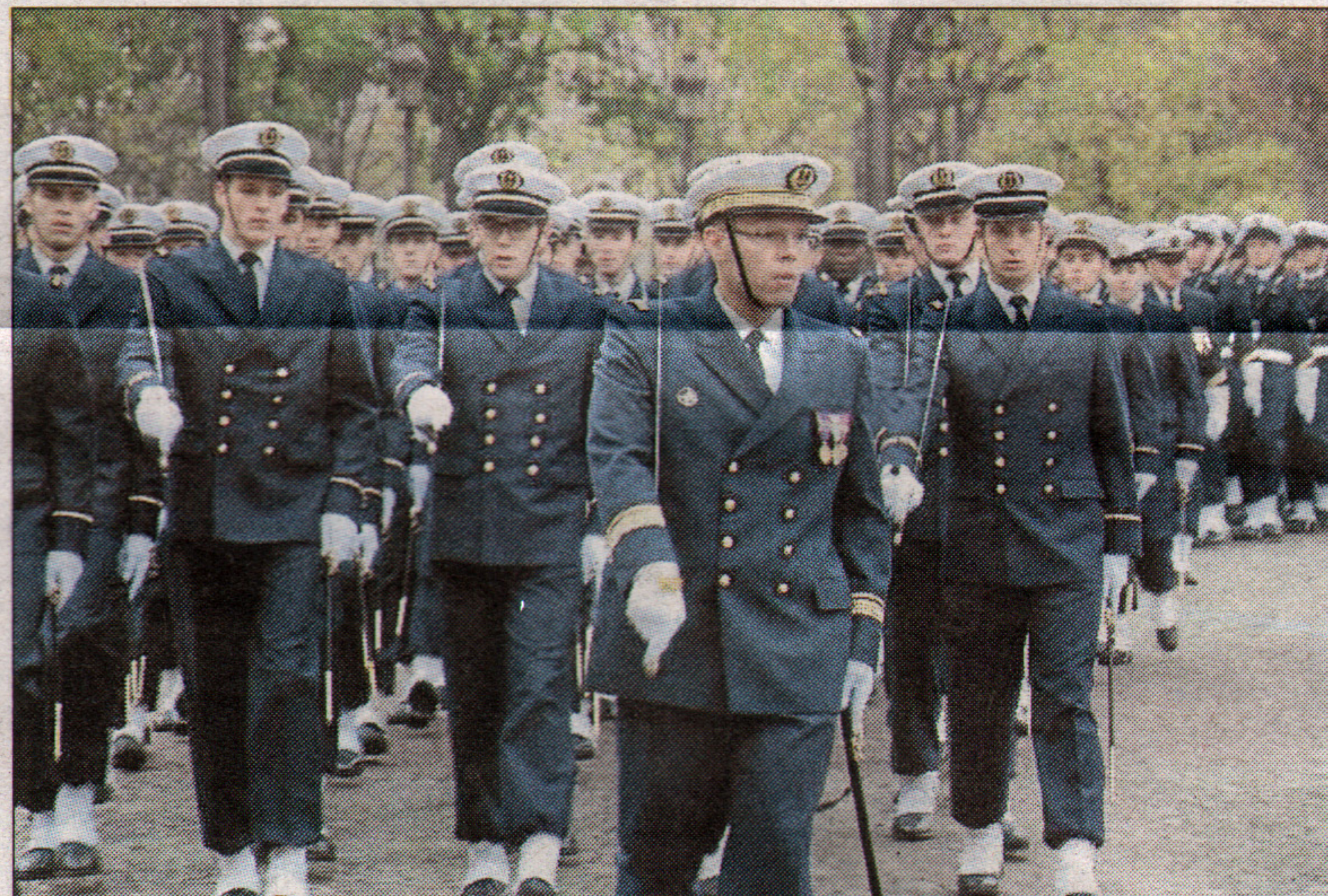
Le défilé des troupes a été très applaudi par les spectateurs qui s'étaient massés à proximité de l'Arc de Triomphe.